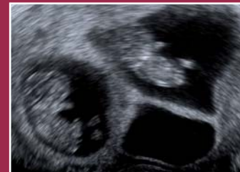
Drillinge: 2 D- und 3 D-Ultraschall