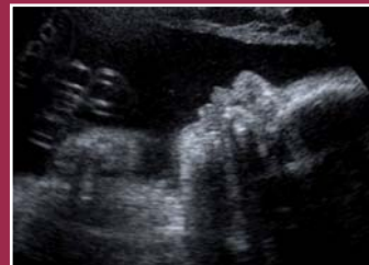
Gesicht: 2 D- und 3 D-Ultraschall